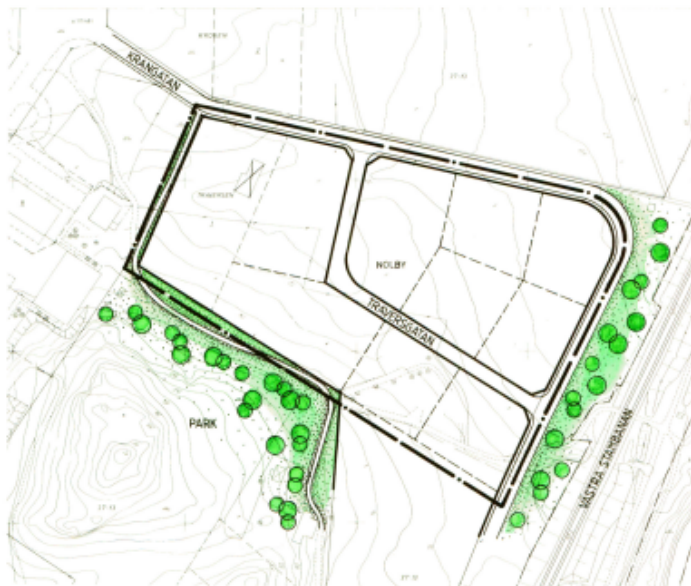
ILLUSTRATIONSKARTA SKALA 1:2000